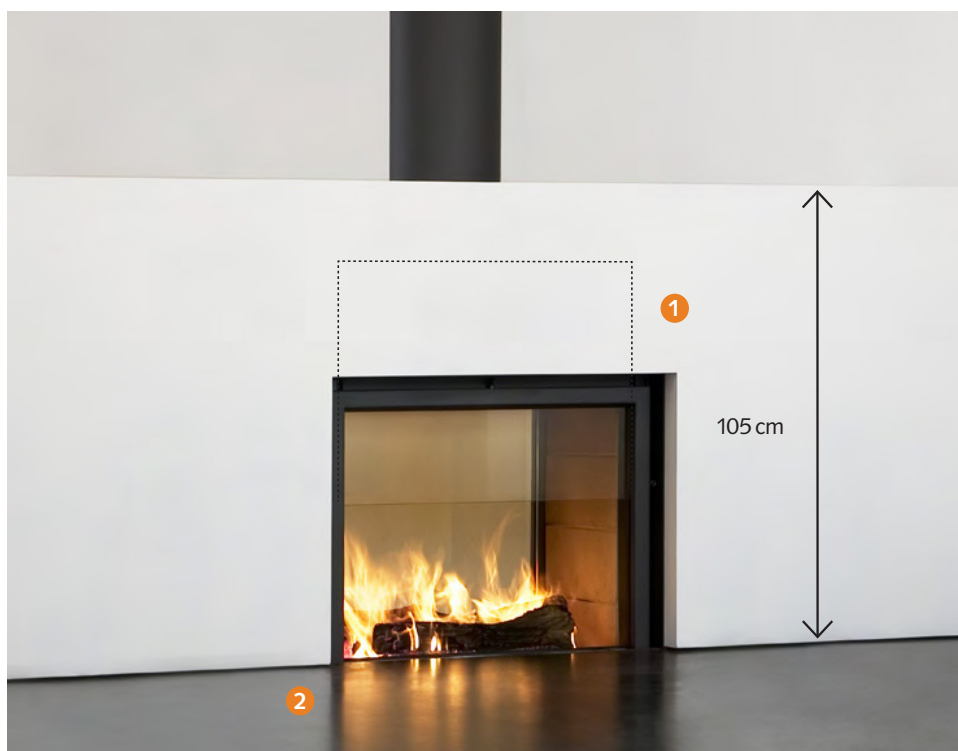
Stův jako první navrhl přístupné vodící lišty, spodní hranu vstupního otvoru do topeniště na úrovni podlahy, prosklení bez kovového profilu na spodní hraně...